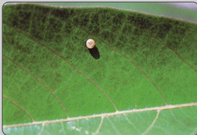
Figura 24 – Ovo de mandarová nas folhas de mandioca.