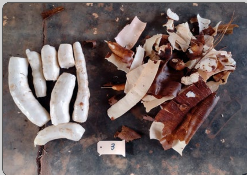
Figura 55 – Detalhe do descarte de 34% no peso durante o processamento.

No processamento das raízes ainda há o descarte das entrecascas e outras deformidades, que podem chegar de 30 a 40%.