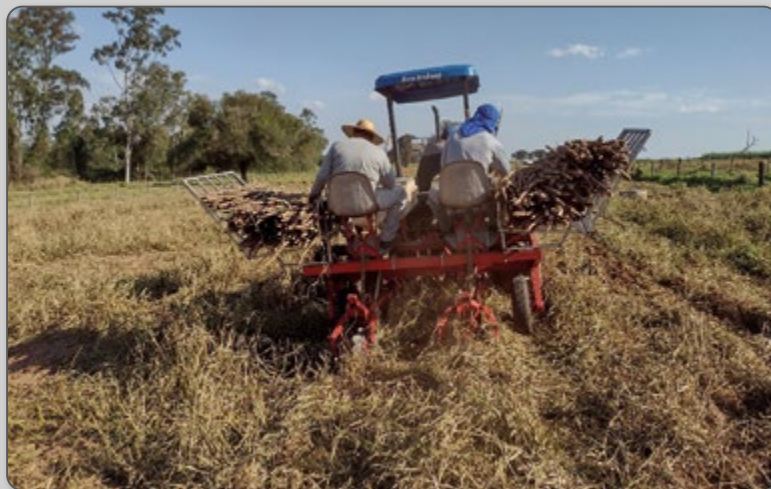
Figura 8 – Plantio mecanizado direto na palhada de pastagem.