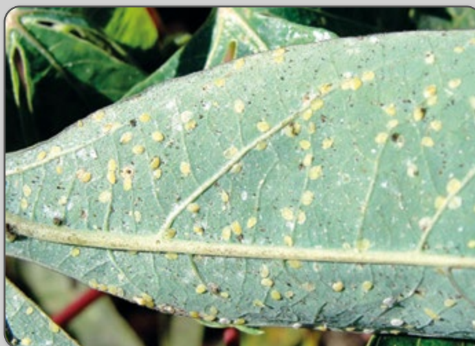
Figura 32 – Ovos de mosca-branca na face inferior das folhas.