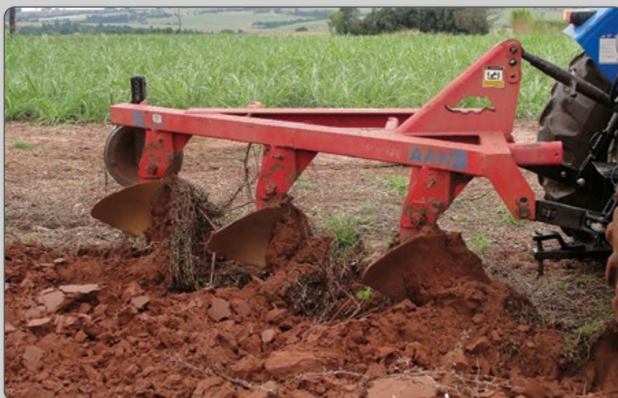
Figura 5 – Arado de aiveca.

A aração em áreas anteriormente ocupadas por outras culturas é, normalmente, a primeira operação de preparo do solo e pode ser feita por arados de disco ou de aiveca.