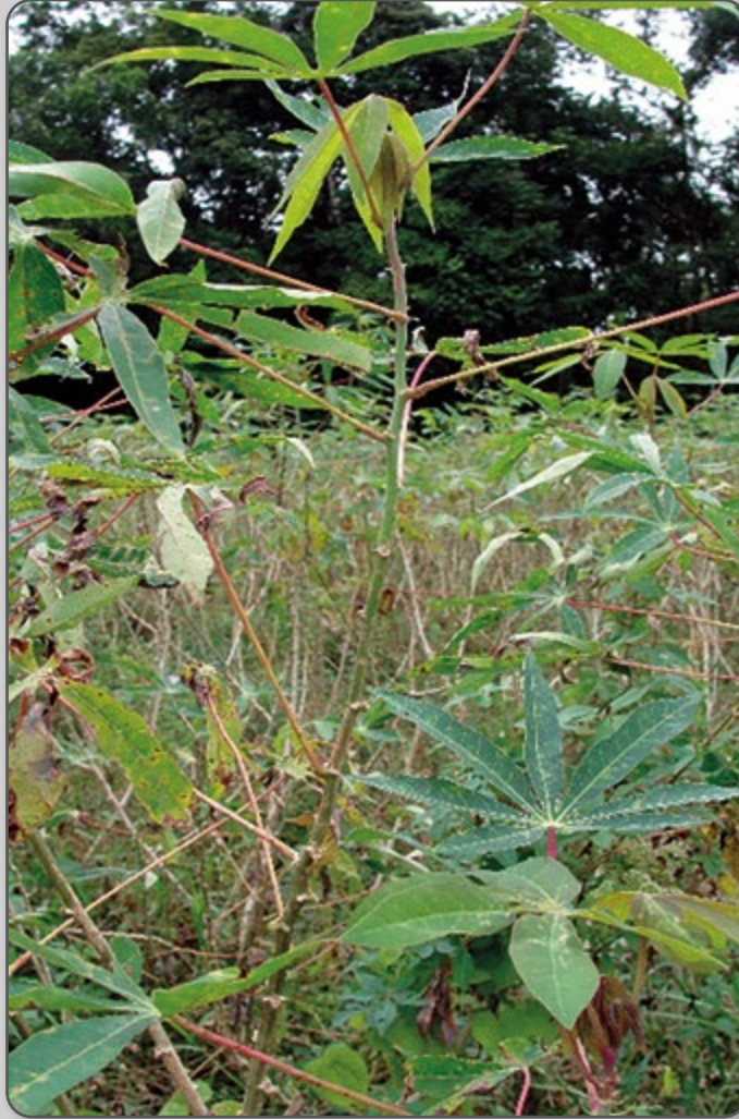
Figura 48 – Superalongamento na parte aérea.