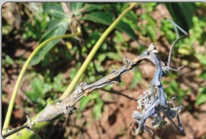
Figura 44 – Sintoma do ataque da antracnose na rama.

A doença conhecida como antracnose é causada por fungos, e sua maior incidência ocorre quando as temperaturas são mais amenas e a umidade relativa é elevada, podendo acarretar lesões que podem se tornar portas de entrada de bacteriose e brocas das ramas.