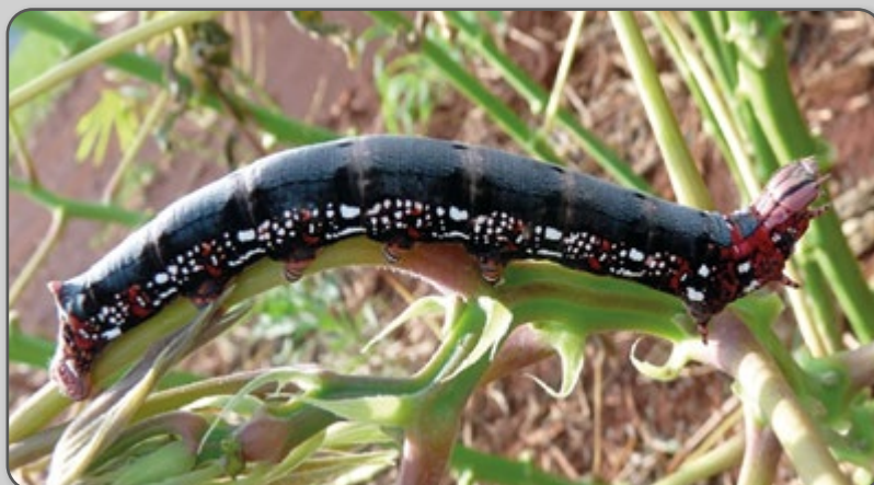
Figura 25 – Mandarová em variação de coloração.

A lagarta pode consumir, durante seu ciclo, em torno de 12 folhas bem desenvolvidas. Desse total, 75% são consumidas na última fase de crescimento, quando a lagarta pode alcançar 12 cm de comprimento. A fase de lagarta dura de 12 a 15 dias, divididos em cinco estágios. A lagarta madura migra para o solo formando casulos de cor marrom com estrias negras, preferindo principalmente locais mais frescos, como debaixo de resíduos de plantas. A mariposa emerge do casulo em 12 a 15 dias.