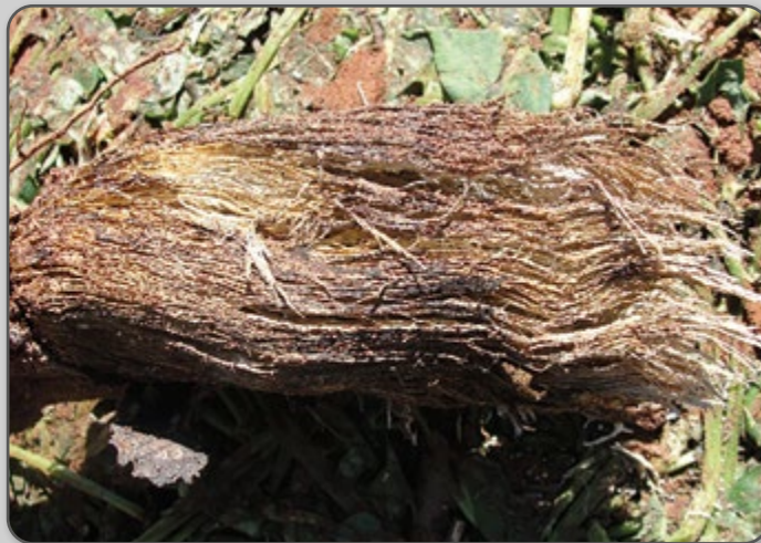
Figura 49 – Podridão seca causada por Fusarium sp.

A compactação do solo, os cultivos sucessivos, o uso de ramas contaminadas, o tombamento causado pelo vento, a calagem excessiva ou solos muito ácidos podem agravar o problema. De maneira geral, a podridão seca, causada por Fusarium sp., ocorre em solos mais ácidos e compactados, em qualquer idade da planta.