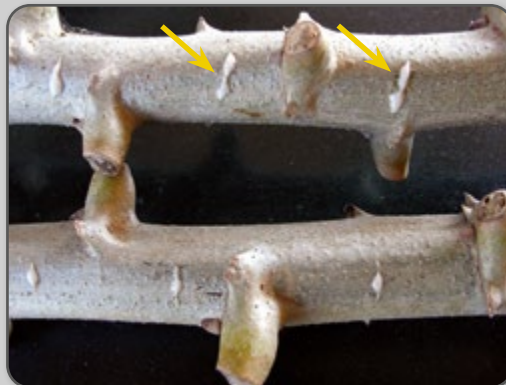
Figura 17 – Teste de viabilidade da rama mostrando a saída da seiva.

A avaliação da viabilidade da rama, guardada ou não, poderá ser executada por meio do teste do canivete. Nela é feito um pequeno corte, e caso a seiva ou o leite flua rápida e abundantemente, a rama presta para plantio.