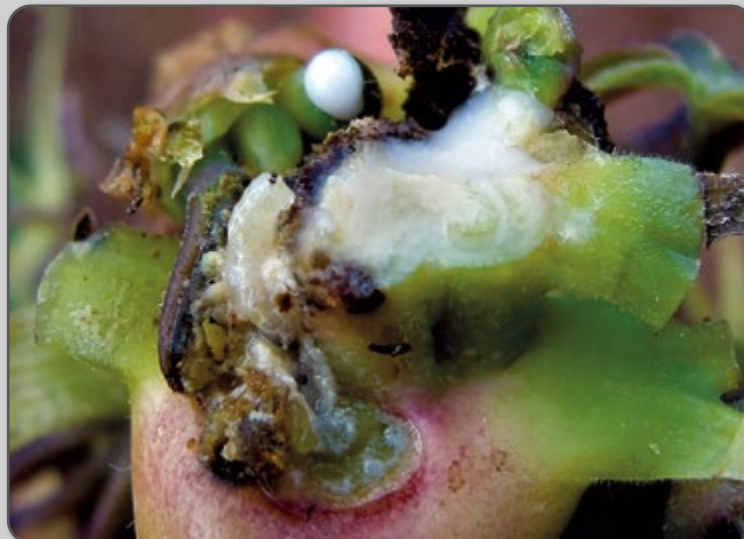
Figura 39 – Detalhe da larva da mosca do broto no ponteiro da planta de mandioca.

A fêmea da mosca-do-broto, normalmente efetua a postura nos ponteiros, e as larvas eclodem após aproximadamente quatro dias, perfurando o tecido das plantas. No broto afetado podem ser encontradas várias larvas esbranquiçadas.