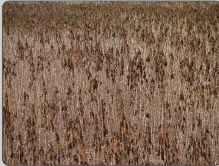
Figura 18 – Lavoura após ocorrência de geada.

As ramas que passaram por geadas e estão intactas por fora podem internamente estar com as células rompidas, tornando a seiva mais rala, e podem comprometer a brotação e o vigor das mudas.