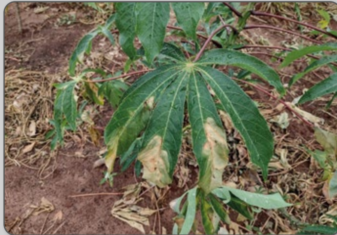
Figura 42 – Sintoma da bacteriose conhecido como escaldadura na folha.