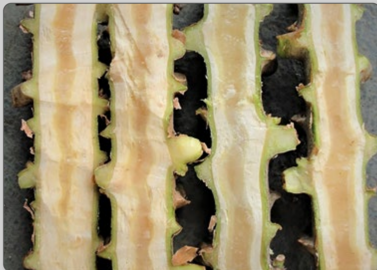
Figura 10 – Mudanças cortadas de diferentes partes da rama.