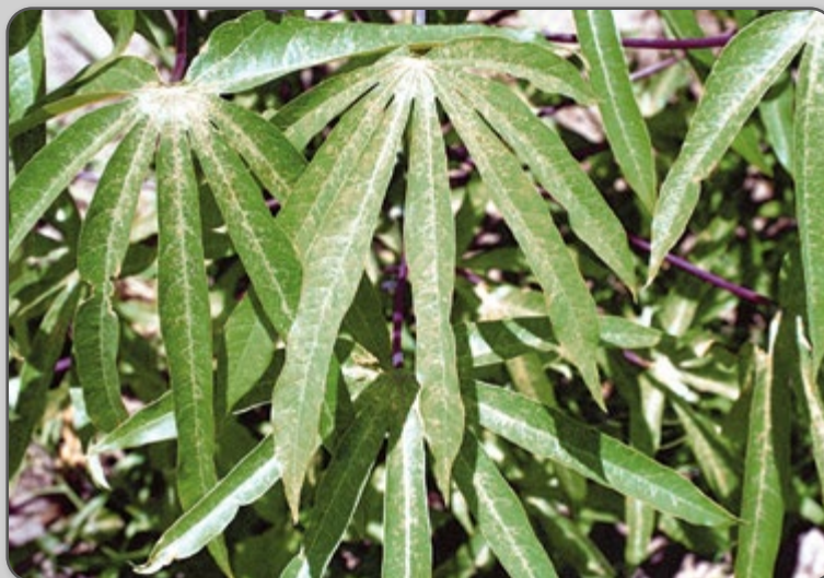
Figura 29 – Sintomas do ataque do percevejo de renda nas folhas de mandioca.