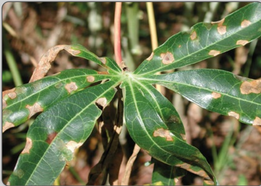
Figura 51 – Sintoma de cercosporiose nas folhas.

Existem várias outras doenças que podem atacar a mandioca, mas que não têm causado grandes problemas, como é o caso da cercosporiose, que normalmente ocorre ao fim do ciclo da cultura ou quando as condições climáticas são muito atípicas.