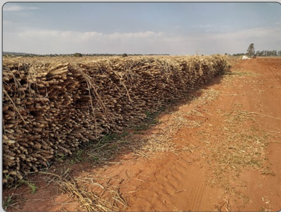
Figura 15 – Ramas armazenadas na horizontal.

A durabilidade das ramas na armazenagem depende da variedade de mandioca. Esse é um detalhe importante de ser observado.