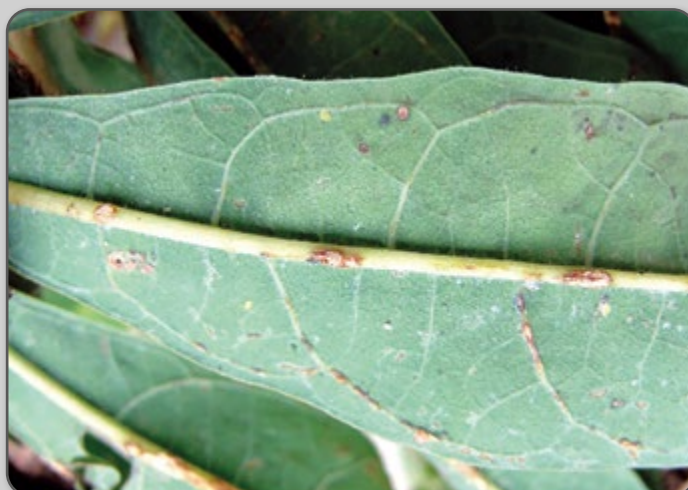
Figura 47 – Necrose das nervuras das folhas devido ao superalongamento.