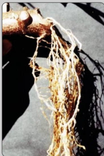
Figura 14 – Enraizamento de muda cortada em bisel.

O feixe das ramas deve ser firme e, quando necessário, deverá ser amarrado com duas cordas e transportado com o máximo cuidado. A integridade das gemas ou olhos é de extrema importância, pois é nesse ponto que ocorrerá a brotação. As ramas com muitos ferimentos aumentam consideravelmente o risco de doenças na fase inicial da lavoura.