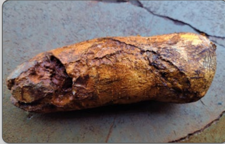
Figura 38 – Ataque de migdolus nas raízes.