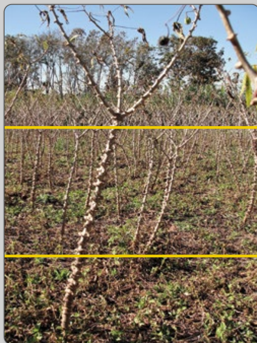
Figura 11 – Porção da planta para retirada das mudas.

O melhor segmento para mudas é o retirado do terço médio da rama para baixo. As mudas do ponteiro são mais finas e imaturas, e as da base da planta são mais lenhosas e mais resistentes à seca.