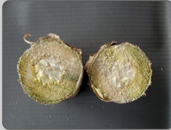
Figura 19 – Diâmetro da muda de mandioca.

Um diâmetro médio total de 2 cm é recomendado, com uma proporção conforme a figura a seguir.