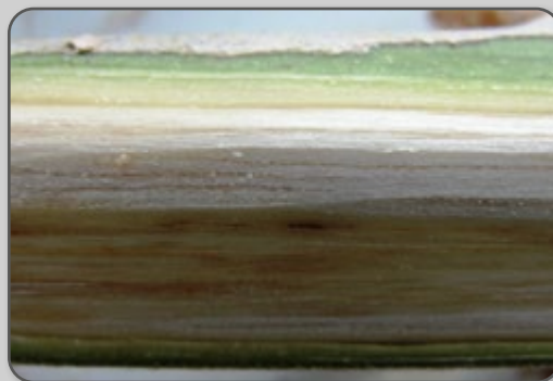
Figura 43 – Vasos condutores escurecidos devido à bacteriose.