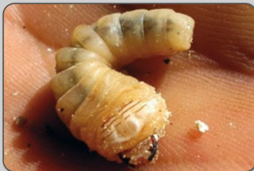
Figura 37 – Migdolus na fase larval, quando ataca as raízes.

Trata-se de um besouro que no estágio larval ataca as raízes de mandioca, cana e pastagens. Seu ciclo biológico completo pode durar até 12 meses.