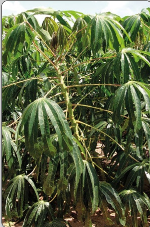
Figura 21 – Parte aérea da IPR Upira.