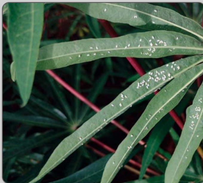
Figura 31 – Mosca-branca na face inferior das folhas de mandioca.

Os adultos da mosca-branca localizam-se principalmente no ponteiro das plantas.