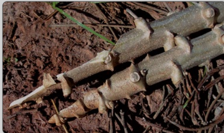
Figura 12 – Ramas cortadas de maneira inadequada em bisel.

O corte das ramas deve ser feito o mais reto possível e sem ferimentos, evitando o formato em bisel (corte enviesado), que acarreta muitas perdas na armazenagem e no plantio. No corte das ramas é importante mais uma seleção com relação às pragas e doenças e misturas de variedades.