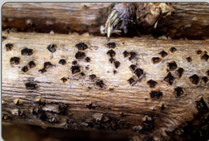
Figura 45 – Antracnose em ramas armazenadas para plantio.