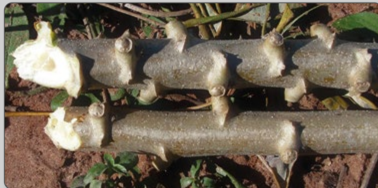
Figura 13 – Ramas cortadas retas, de maneira mais adequada.