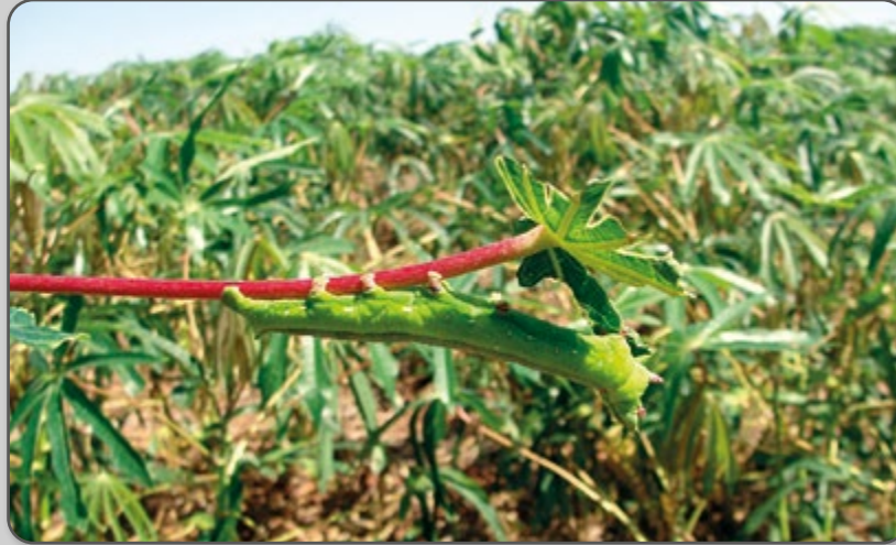
Figura 26 – Ataque do mandarová em folhas de mandioca.