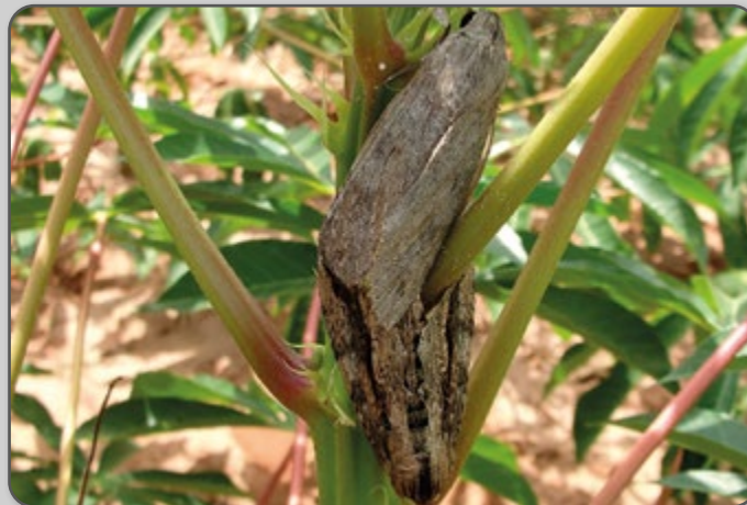
Figura 23 – Mariposa do mandarová.

O adulto do mandarová é uma mariposa de hábitos noturnos, com asas anteriores acinzentadas e posteriores avermelhadas, com bordos pretos e o abdome cinza, com faixas pretas, mas pode apresentar variações. Geralmente a mariposa põe os ovos durante a noite.