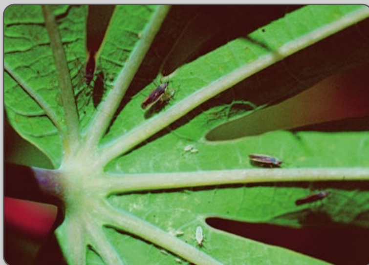
Figura 28 – Percevejo de renda em diferentes estágios de crescimento.

A postura ocorre dentro das folhas. Essa fase dura em média de 8 a 15 dias. A fase de ninfa tem duração aproximada de 12 a 17 dias, e a fase adulta pode durar até 90 dias.