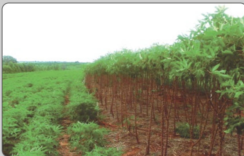
Figura 53 – Detalhes de lotes com e sem poda.

Normalmente após a poda aumenta-se o número de hastes por planta.