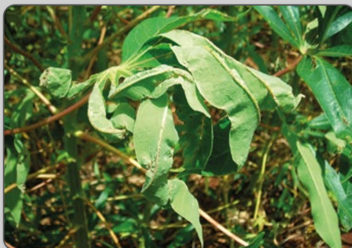
Figura 46 – Sintoma do superalongamento nas folhas.

Áreas com ataques mais severos não poderão servir como fonte de material de plantio para a próxima lavoura.