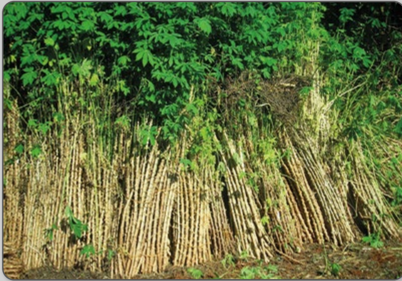
Figura 16 – Ramas armazenadas na vertical.