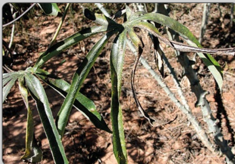
Figura 30 – Ocorrência de fumagina após ataque de mosca-branca.

As moscas-brancas causam, na mandioca, sintomas como o amarelecimento e a secagem das folhas mais velhas, além de deformações do ponteiro. Dependendo do ataque poderá haver crescimento de fungos escuros, conhecidos como fumagina, nas folhas e hastes, além de comprometimento da qualidade da rama para plantio.