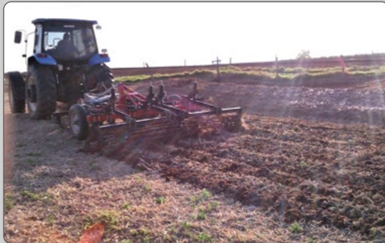
Figura 7 – Passagem de escarificador-destorroador.

Em áreas nas quais anteriormente havia outras culturas o custo do preparo é menor pela redução do número de operações.