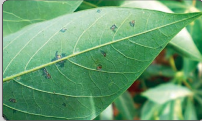
Figura 41 – Sintoma de bacteriose na parte inferior da folha.