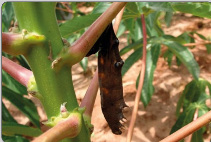
Figura 27 – Mandarová contaminado por baculovírus.