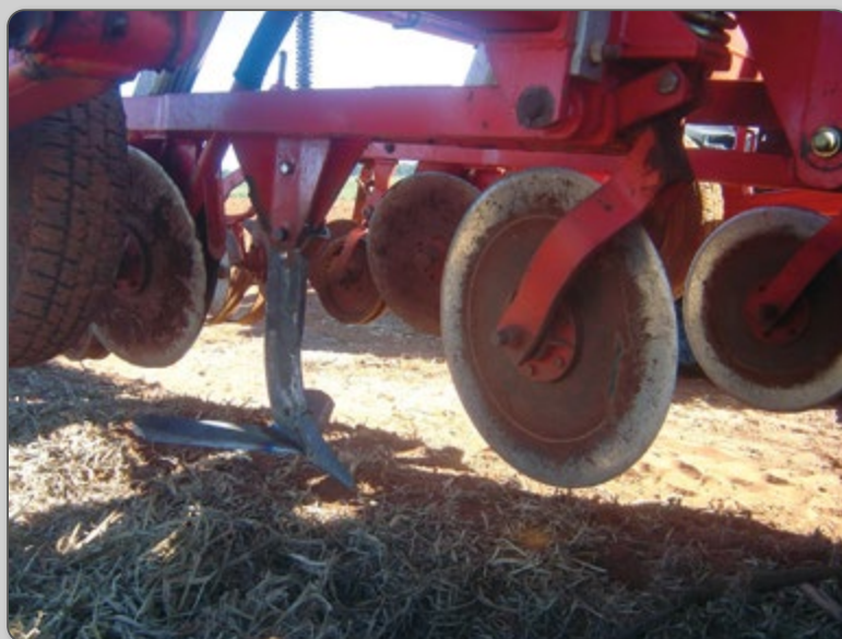
Figura 9 – Kit para plantio direto mecanizado.