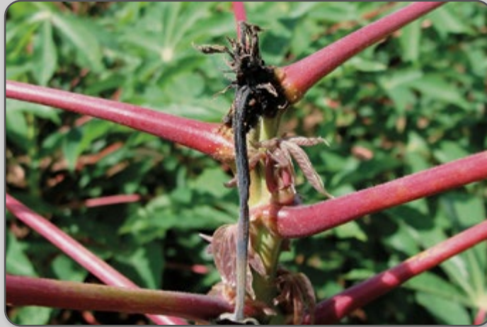
Figura 40 – Planta com sintoma de ataque da mosca-do-broto.

As plantas mais jovens são mais sensíveis ao ataque da mosca-do-broto. Nas plantas mais velhas o ataque diminui, pois o endurecimento das hastes das plantas dificulta a penetração das larvas. O ataque pode induzir à emissão de ramos laterais.