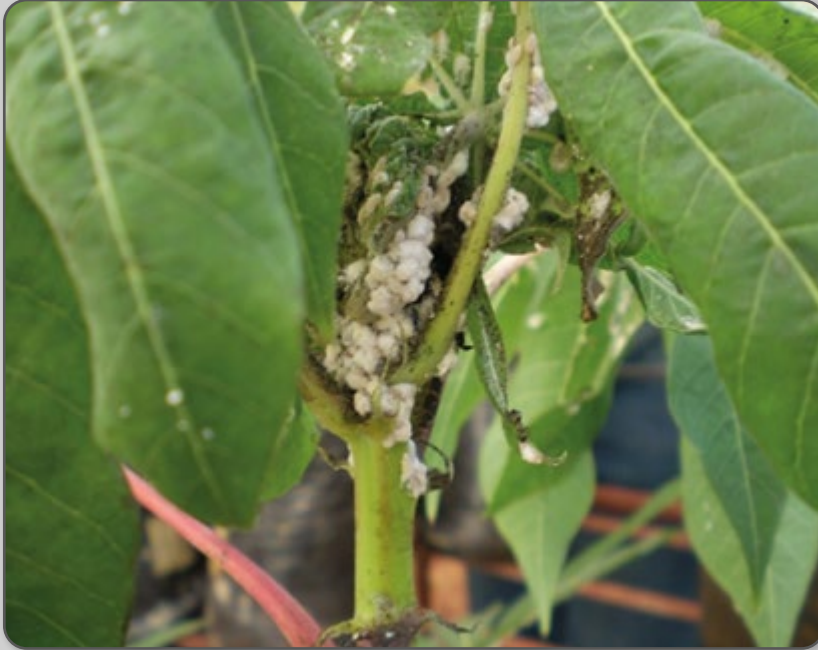
Figura 33 – Cochonilha da parte aérea no ponteiro da planta.