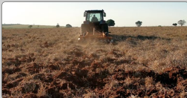
Figura 4 – Operação de preparo com grade aradora em pastagem dessecada.

A segunda gradagem deve ser feita, se possível, no sentido transversal da primeira, sendo necessário cortar as leivas (torrões) em pedaços menores para que as plantas daninhas morram com maior facilidade.