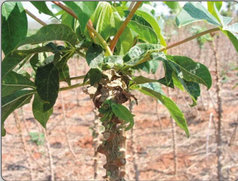
Figura 34 – Sintoma nas folhas do ataque de cochonilhas.