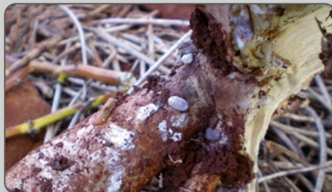
Figura 36 – Cochonilha da raiz.

As cochonilhas que atacam as raízes não são as mesmas que atacam a parte aérea. Em plantas com elevada infestação, ocorre clorose (amarelecimento) nas folhas basais, com queda gradativa. Nas raízes atacadas são visíveis pontos negros no interior da casca, com estrias provocadas provavelmente por substâncias tóxicas liberadas pelo inseto durante sua alimentação, podendo induzir à podridão radicular.