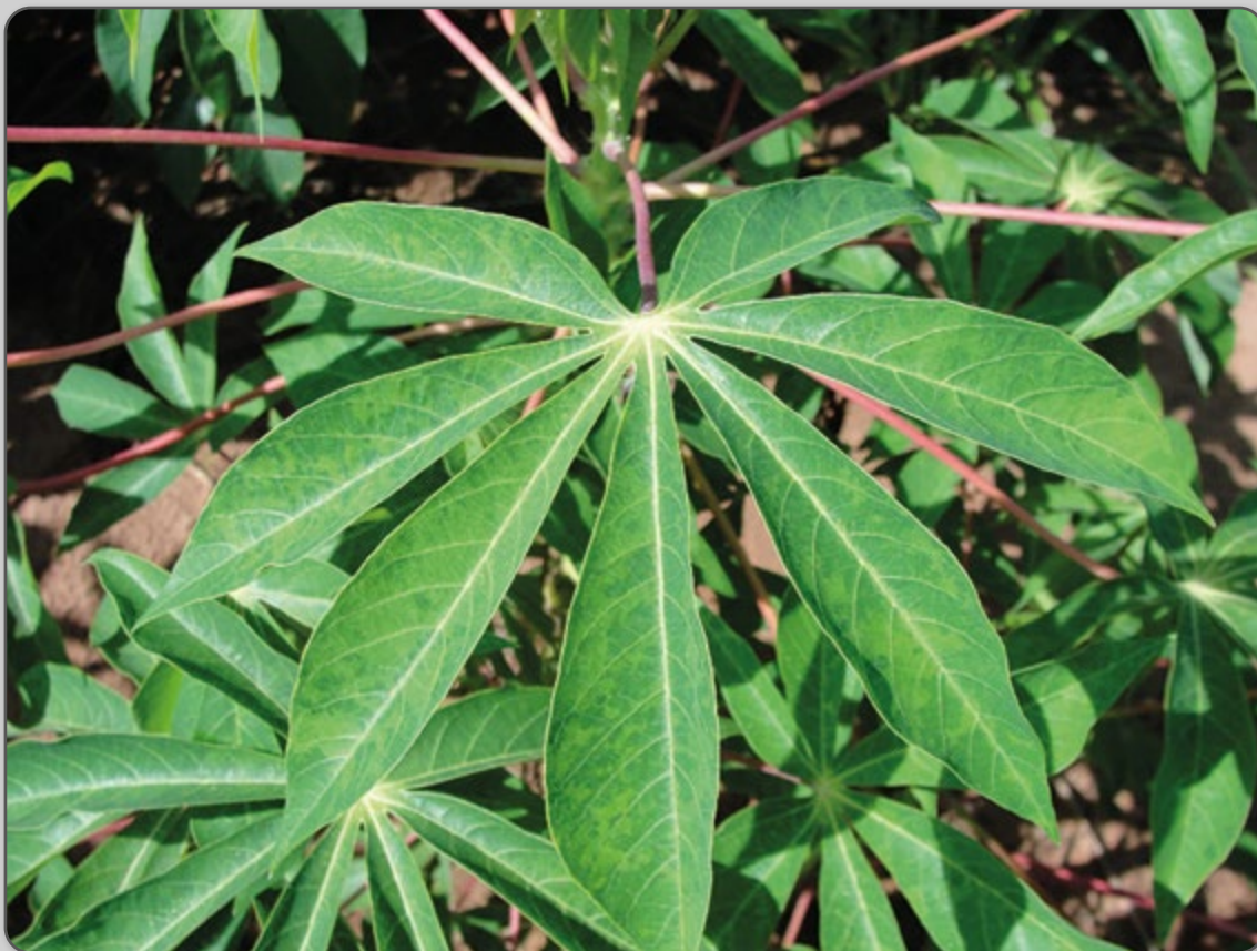
Figura 52 – Sintomas de Virose do Mosaico Comum (CsCMV).