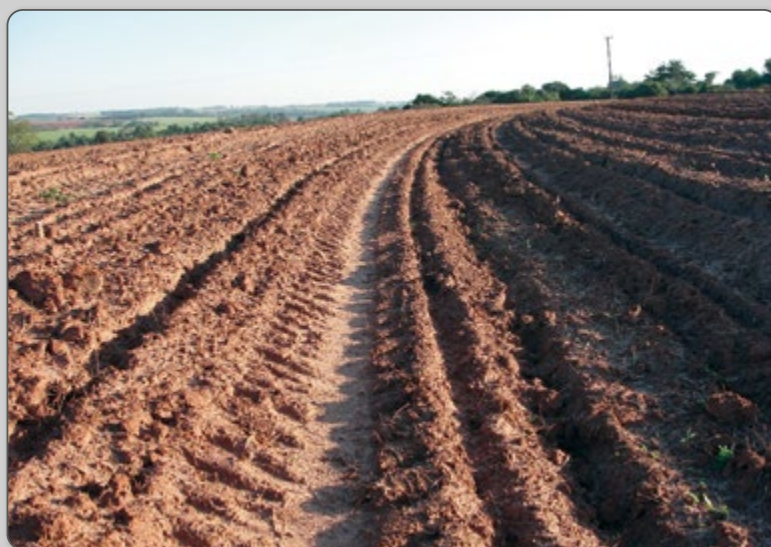
Figura 6 – Terraço de base larga em área preparada com grade niveladora e recém-plantada.

Nessa operação, dependendo do tipo de terraço e do equipamento, são utilizadas de 0,6 a 1,5 horas máquina/ha. Terraceadores também poderão ser utilizados.