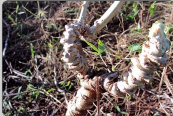
Figura 35 – Sintomas secundários do ataque da cochonilha da parte aérea.

O uso de material de plantio oriundo de áreas atacadas pela cochonilha deve ser evitado, pois constitui uma das principais formas de disseminação da praga. Também é recomendável o uso moderado de inseticidas do grupo químico dos piretroides, no intuito de preservar os inimigos naturais da cochonilha.