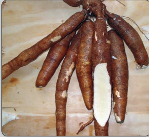
Figura 20 – Raízes da variedade IPR Upira.