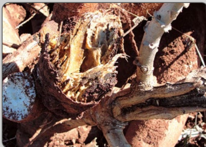
Figura 50 – Podridão mole causada por Phytophthora sp.

A podridão mole, causada por Phytophthora sp., ocorre em plantas mais velhas, em solo com pH mais neutro e em áreas mais encharcadas.