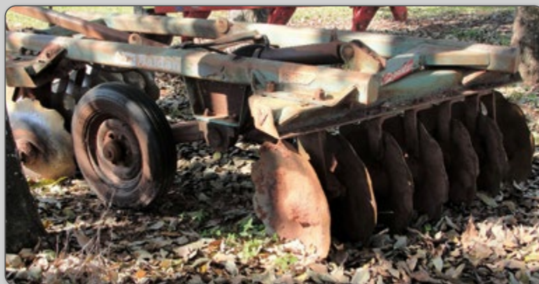
Figura 3 – Grade aradora ou “rome”.

O equipamento utilizado nesse processo é a grade aradora, popularmente conhecida como grade rome, que varia de tamanho, número e tamanho de discos, fabricante e modelo.