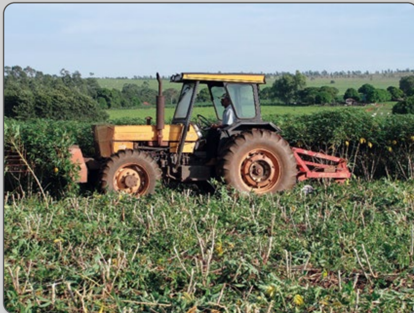
Figura 54 – Passagem do afofador com roçadeira frontal.

A segunda etapa é a extração das raízes do solo, que pode ter o auxílio de ferramentas, tais como o “jacaré” ou alavancas, picaretas pequenas e enxadão.