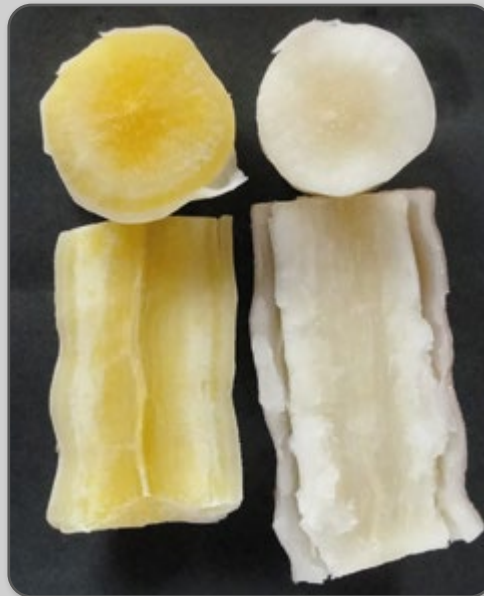
Figura 22 – IPR Upira de raiz amarela comparada à variedade branca.

A IPR Upira tolera a bacteriose (doença causada por bactéria), a antracnose e o superalongamento (ambas as doenças causadas por fungos), mas é sensível a podridões radiculares.